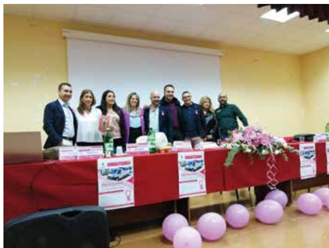
I partecipanti al convegno