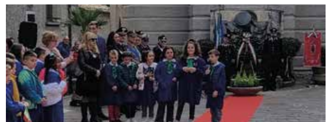
Gli alunni che hanno letto la poesia

Durante la manifestazione, che si è svolta in piazza Giuseppe Amantea, sei bambini della scuola primaria di Grimaldi hanno recitato la prima parte della poesia "Nasceranno uomini migliori", di Nazim Hikmet.