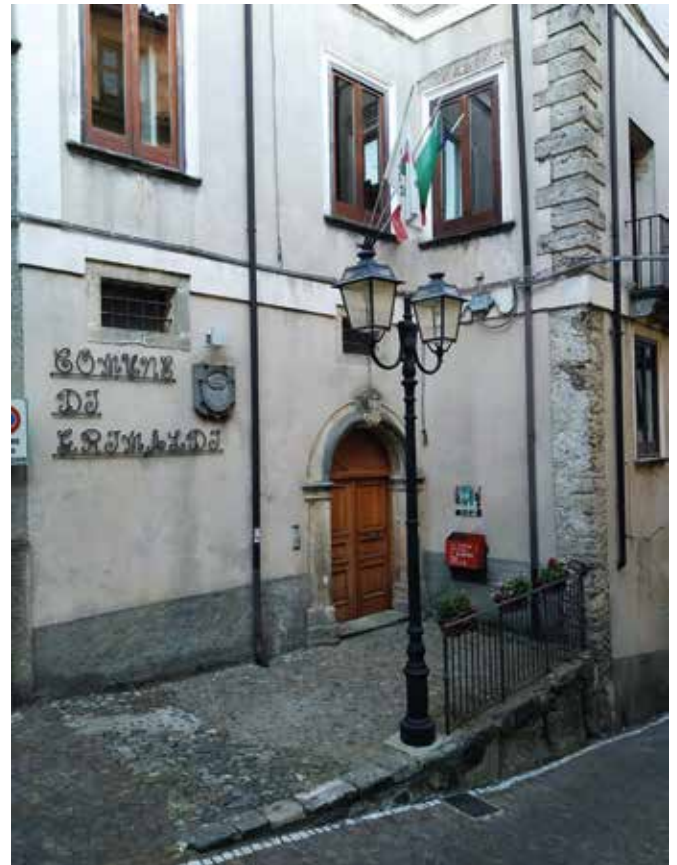
La sede del Comune di Grimaldi

procedure di liquidazione dovranno iniziare nel tempo di tre mesi. L'intervento pragmatico e responsabile del ministero, sarà certamente di aiuto per il superamento delle perplessità e dei dubbi sorti sulle procedure e sulle competenze. Credo che sia giunto il tempo di uscire da questo impasse e auspico che ci sia, da parte di tutti: amministrazione, commissario e consiglieri, un atteggiamento di impegno e di piena collaborazione; in primo luogo perché ci sono creditori che aspettano i loro diritti da tanti anni e anche perché stiamo andando verso la fine della legislatura.