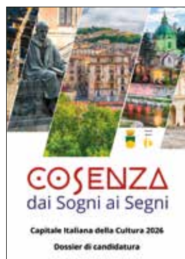
Cosenza Capitale della Cultura