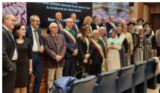
La foto di gruppo dei sindaci

una menzione speciale per il suo racconto breve intitolato "Alcune considerazioni sull'amicizia."