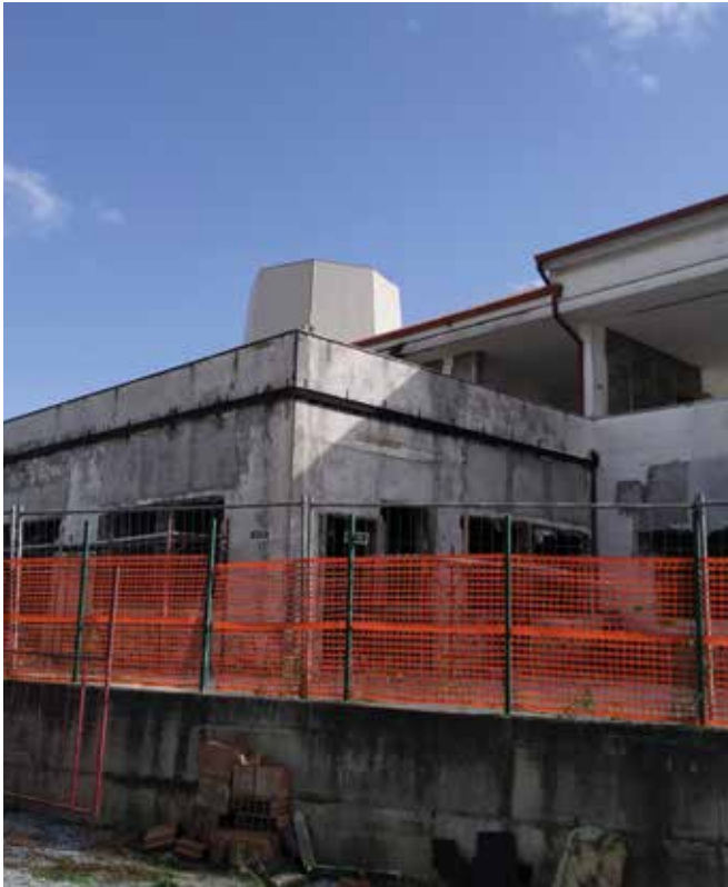
Lavori in corso della struttura sociale