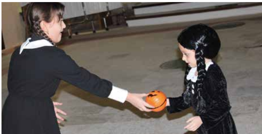
Momenti della festa