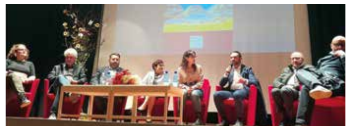
Un momento della presentazione dell'antologia al pubblico lo scorso 6 novembre