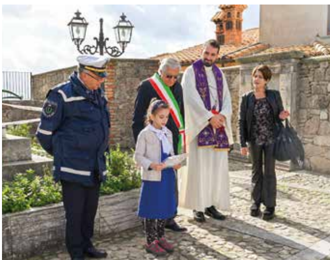
Un'alunna legge un pensiero sul 4 novembre