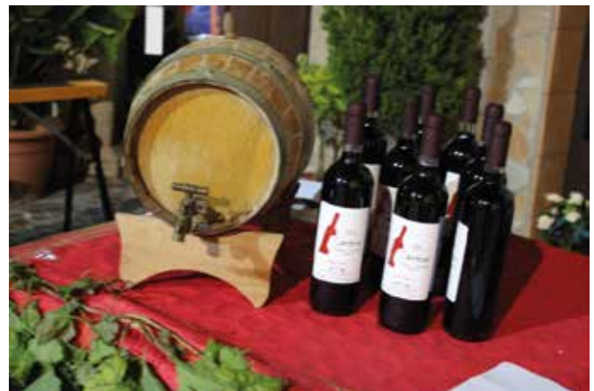
Uno stand della cantina