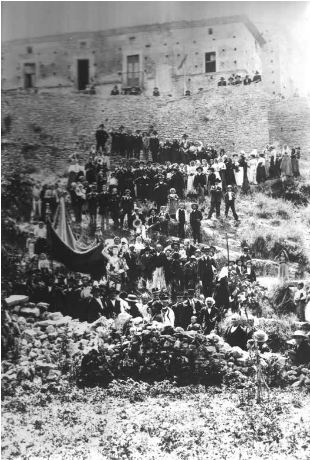
PROCESSIONE SAN SEBASTIANO AD ALTILIA, SOTTO AL GIRONE, IN "VIA DI CAVADDI" - CASA MICELI PAGLIUSO ROMANO

In questa rubrica vengono pubblicate le foto di un tempo che fu. Ogni famiglia possiede in casa, nei cassetti istantanee custodite gelosamente che ricordano i propri cari e i luoghi dove vissero. Ad ogni uscita di Orizzonte Savuto pubblicheremo una singola foto: chi volesse inviarne una per ricordare un parente, una festa in paese, un momento storico, può inviare il tutto alla mail orizzontesavuto@gmail.com