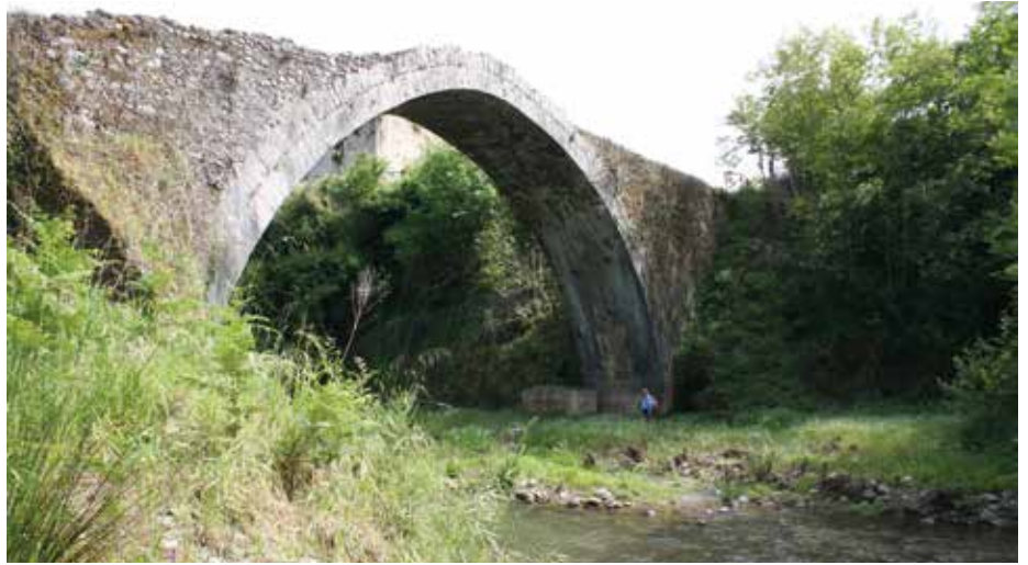
Il ponte detto di Annibale dal versante di Altilia