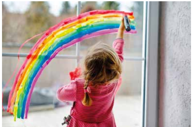
Un simbolo di pace

anche la pace: basta la tenerezza di un animaletto, basta la spensieratezza e la sana ingenuità di un bambino, per renderla forte, per diffondere messaggi di solidarietà sociale e profonda bontà.