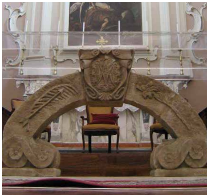
Altare Chiesa S. Maria Assunta - Altilia