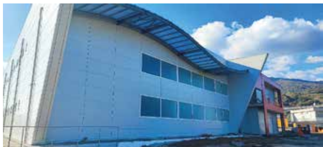
Un'ala del Centro commerciale

comunità". A proposito del Centro commerciale il sindaco ha, proprio pochi giorni fa, informato la cittadinanza che il Centro commerciale sarà operativo con impianti di depurazione rete fognante e rete idrica, avendo già dato inizio ai lavori. "A seguito dei finanziamenti ottenuti dal Ministero e dalla Regione Calabria, - ha dichiarato De Rose - la zona Petrarizzi dove sono state costruite le opere Piattaforma distribuzione prodotti alimentari, Centro commerciale e Banca di prossima apertura, avrà la costruzione della nuova Rete idrica come in tutte le zone del Basso Savuto, e nella zona Balzatelle e Campi. Un territorio - ha concluso il primo cittadino - con opere significative che garantiscono servizi primari per i cittadini, i quali potranno guardare con più fiducia alla crescita sociale ed economica dell'intera comunità.