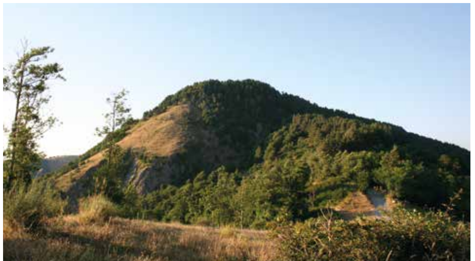
Monte S. Lucerna a Grimaldi