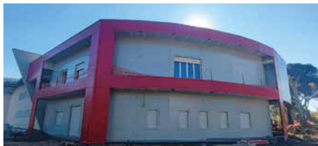
L'edificio del Centro commerciale