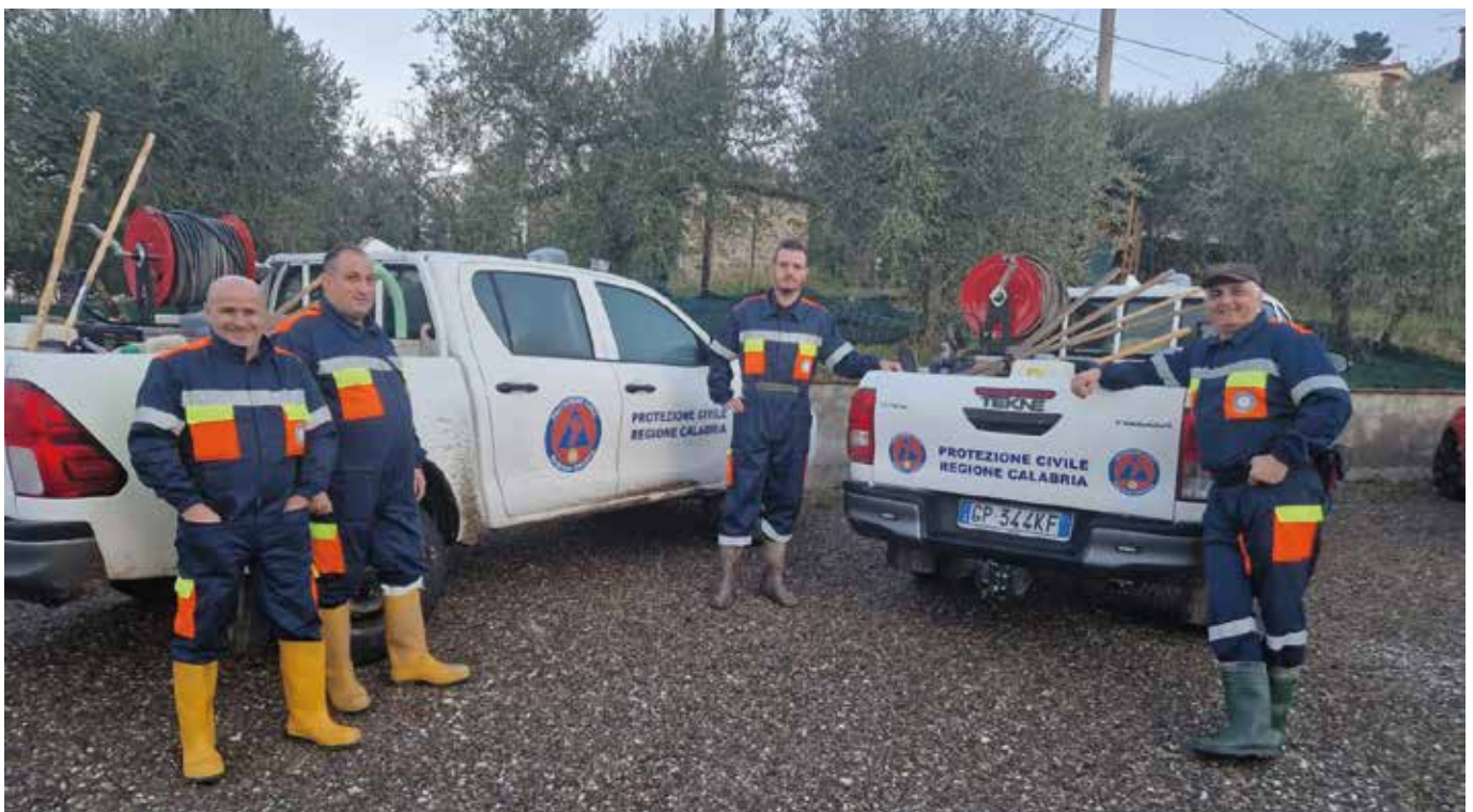
I volontari di Grimaldi partiti per la Toscana

la Toscana alluvionata, e in particolare a Campo Bisenzio. Il capo della Protezione civile calabrese Domenico Costarella ha raccontato di un'esperienza umana "fortissima" nel portare aiuto agli abitanti nelle zone colpite.