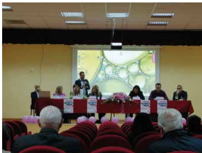
Un momento del convegno