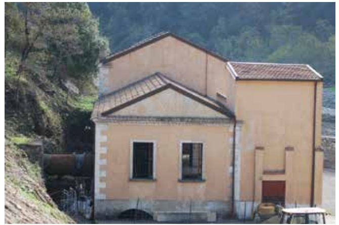
La centralina idroelettrica attuale