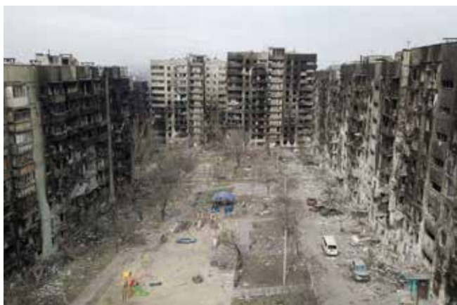
Una immagine della distruzione che causa la guerra

A ribadire ciò che è stato scritto in questo articolo, di seguito una bellissima poesia di Gianni Rodari che parla di pace: