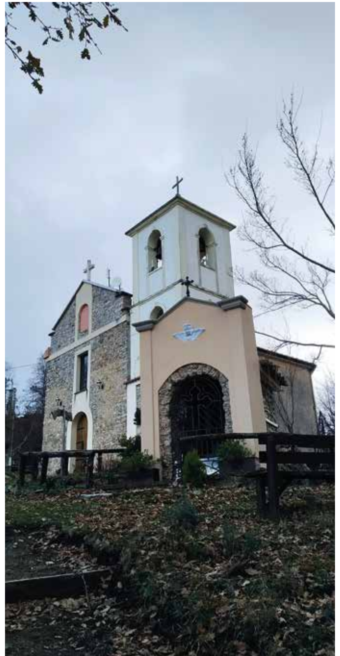
La chiesetta della Querciuola