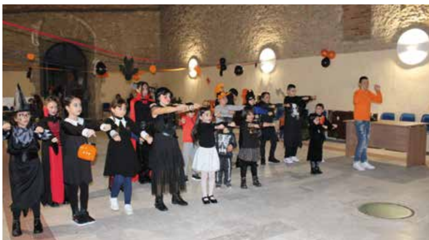
Balli di gruppo