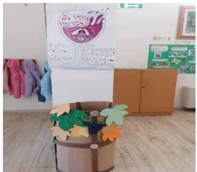
La festa del vino a scuola