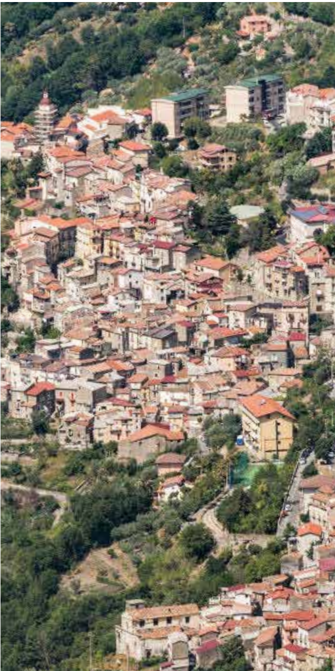
Un panorama di Confienti