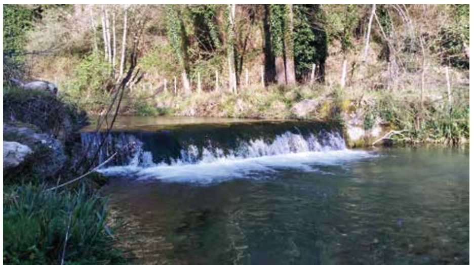
Il corso d'acqua del fiume Russo in loc. Sinni a Maione