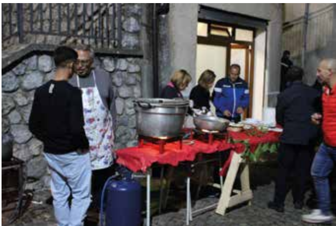
Uno degli stand gastronomici