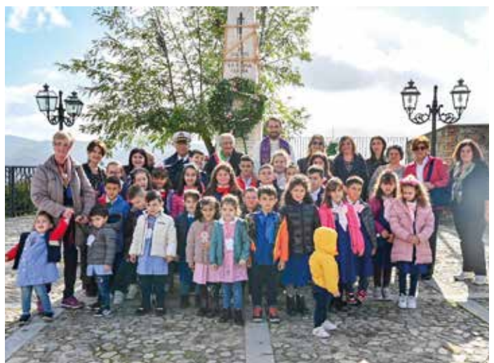
La scolaresca davanti al Monumento ai Caduti con le insegnanti, insieme al sindaco, al vicesindaco, al presidente del Consiglio, e al vigile urbano