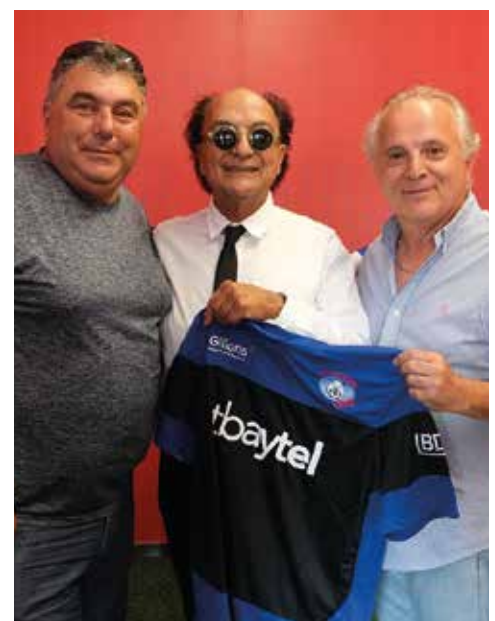
L'incontro tra i presidenti