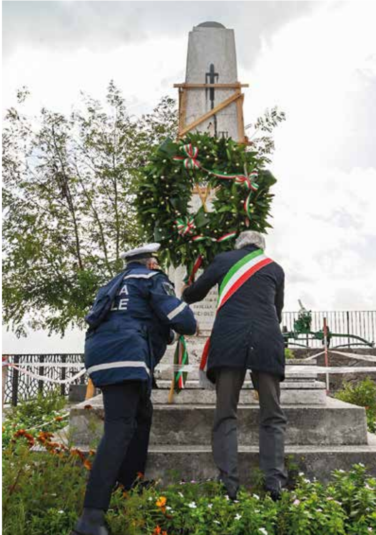
Il sindaco mentre depona la corona d'alloro davanti al Monumento ai caduti

Presenti cittadini, dipendenti comunali, giovani servizio civile, scolaresche