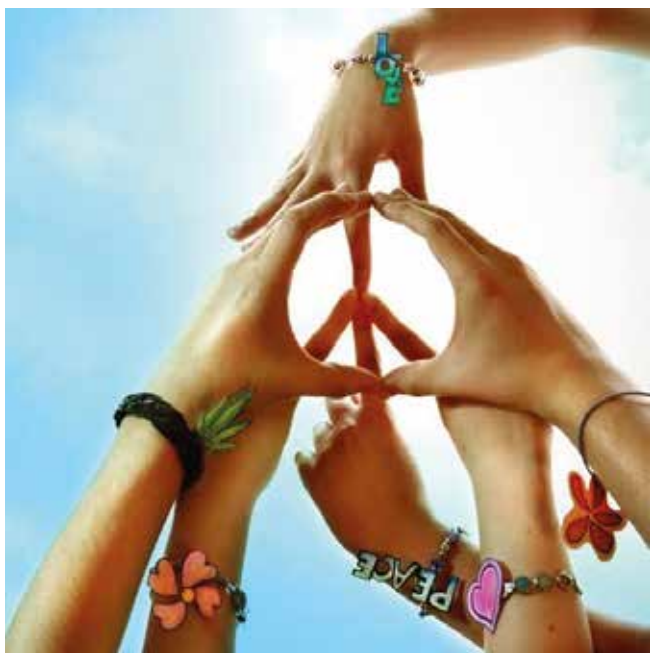
Una simbolo di pace