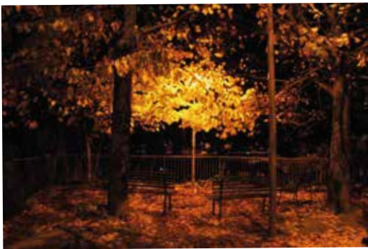
Uno scorcio serale

Oltre le brune vette sol vermiglio. Steso sopra le case il dolce caglio. Testimone che va da padre a figlio, nei secoli mai fu minimo sbaglio. Arrivi tu, oh dolce amata sera! Del mio castigo sei la ricompensa. Il calmo mare, desco la scogliera. Lo smacchiatore della veste bianca. Cessato è nei campi il mio solcare. Appeso il sudore al chiodo fisso capire poi, dal fondo dell'abisso se buoni frutti ha dato il seminare. Se poi di sole non vedrò più raggio, dolce rimane questo tuo passaggio.